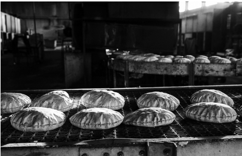
Bäckerei in Qamishli

Was die Telefonkommunikation angeht, ist es so, dass alle Mobiltelefone entweder im Netz der KRG oder der Türkei nutzen, je nachdem wo man sich befindet. Das Festnetz ist unter der Kontrolle der Tev-Dem & der DSV und scheint gut zu funktionieren. Auch dieses ist kostenlos!