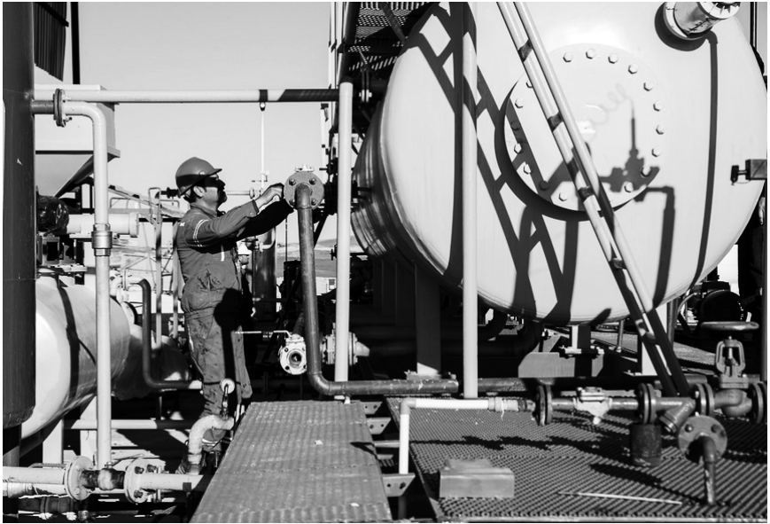
Raffinerie bei Dêrika

wirtschaftlichen und sozialen Leben sowie in der Erziehung schlechter sein würden, als die der Syrier. Der Hauptpunkt der „Grüner Gürtel“-Politik war es, das kurdische Land zu konfiszieren und Araber aus verschiedenen Gebieten dazu zu bringen, auf kurdischem Gebiet zu siedeln, welches dann unter diesen verteilt wurde. Kurz gesagt kamen die kurdischen Bürger unter Assad an dritter Stelle, nach den Arabern und Christen.