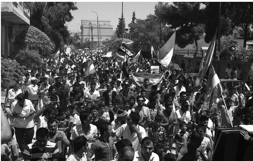
Kurdische Demonstration in Kobanê, 20. Juli 2012.

Der arabische Frühling erreichte Syrien Anfang 2011 und weitete sich nach kurzer Zeit auch auf die syrisch-kurdischen Kantone Cizîrê, Kobanê und Efrîn aus. In der kurdischen Bevölkerung dieser drei Kan-