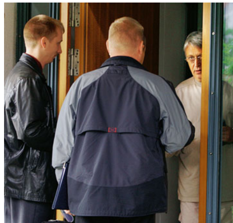
Hausdurchsuchung bei Ex-Minister Schommer

Doch wenn es darum geht, echte oder vermeintliche Gegner zu bekämpfen, darf