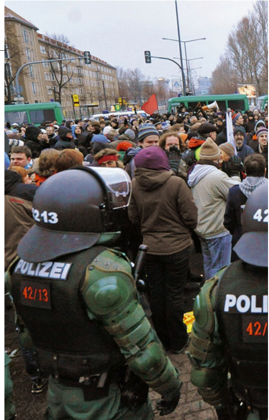
Protest gegen Nazi-Demo in Dresden: Offenbar

Anhaltspunkte für den Verdacht scheint es kaum zu geben. In den Akten heißt es nur, die Angreifer seien gezielt und koordiniert vorgegangen. Dennoch eröffne-