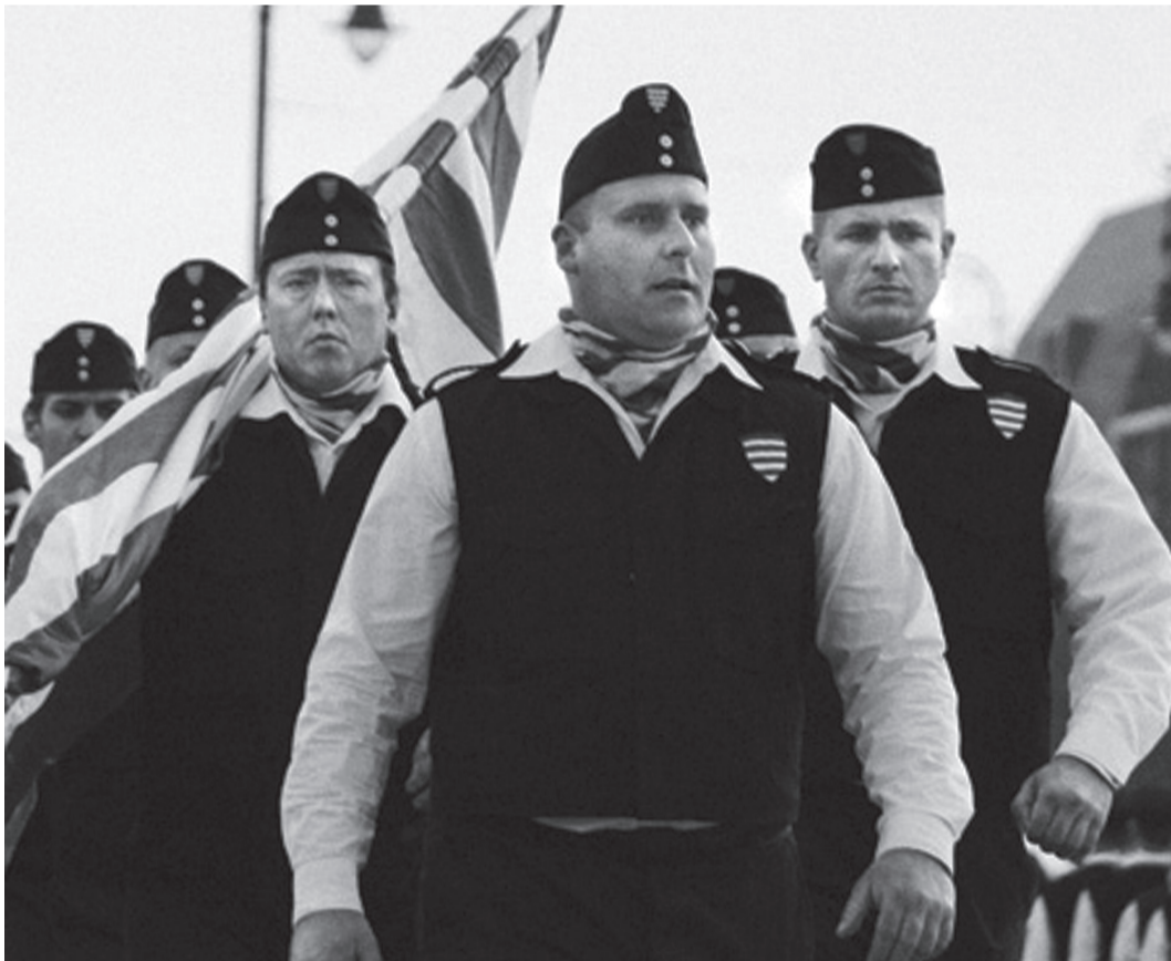
//die militante Vorhut des Antiziganismus in Ungarn

Vor allem in osteuropäischen Ländern ist der Antiziganismus auf einem erschreckenden Vormarsch. Besonders in Ungarn werden die dortigen Roma, mit der Unterstützung der FIDESZ-Regierung von Viktor Orbán, systematisch fertiggemacht.