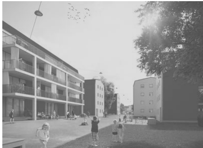
Mettlenweg: von der Genossenschaft zum Investitionsobjekt.

Die meisten Baugenossenschaften beschränken sich auf den Unterhalt oder die Modernisierung ihrer Wohnungen. Das kann, wie die Baugenossenschaft Mettlenweg zeigt, auch mal zu einem Ersatzneubau führen. Die Genossenschaft musste aber, um die Summe von fast 50 Millionen aufzutreiben, mit einem/r Investor_in zusammenarbeiten. Ohne hier für eine umfassende Politisierung argumentieren zu wollen, stellt sich bei den obigen Beispielen die Frage, wer und