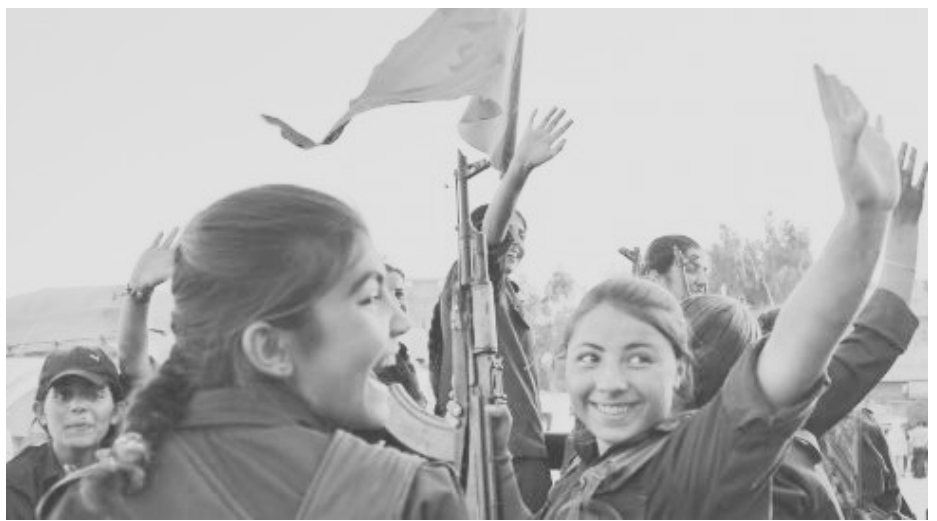
Junge Frauen ziehen mit der Yekîneyên Parastina Jinê (YPJ), der Frauenverteidigungseinheit, in den Krieg.

Die ökonomischen Strukturen bestehen grösstenteils aus Kooperativen. Ein kapitalistisches Wirtschaftssystem wird abgelehnt. Ziel ist eine Ökonomie, die sich an lokalen Bedürfnissen anstelle