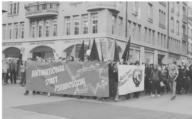
Demonstration „Antinational statt pseudosozial“ am 1. November, welche unter anderem gegen Ecopop war:

Doch allzu viel Selbstbestimmung sollen diese Leute dann doch nicht erhalten. Gemäss den Initiant_innen ist gerade unser westliche Lebensstandard ein Grund für die Migrationsströme. Und würde man die