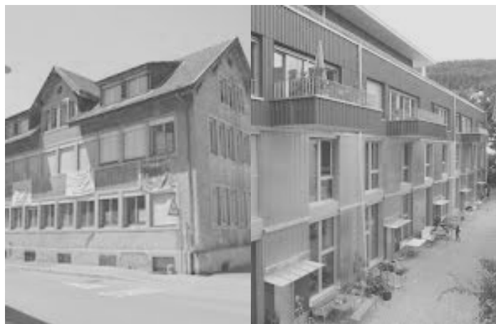
Fabrikgässli: vom Kollektiv zur Genossenschaft.

nicht, um langfristige Tendenzen beobachten zu können. Ein letzter Faktor ist die Annahme, dass Organisationsmuster geprägt werden, bevor eine Gruppe Erfolge hat, zur Massenorganisation wird oder – ganz ungewollt natürlich – zur staatstragenden Institution.