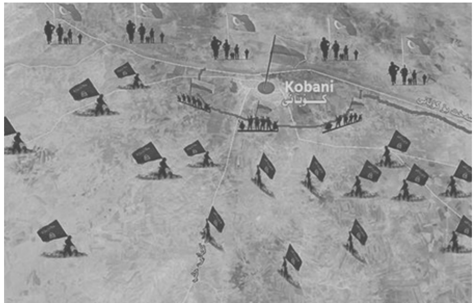
Kobane umzingelt: vorne greift der islamische Staat an und hinten formiert sich bereits die türkische Armee, wahrscheinlich nicht gegen den IS...

gend“. Sie alle nehmen teil an den Volksräten und bestimmen mit. Auf der Strasse und in den Schulen organisieren sie sich, bilden eigene Komitees zu Themen wie Medien, Kultur oder Kunst. Im Interview sprechen die Jugendlichen darüber, dass sie nebst der gesellschaftlichen eine geistige Revolution wollen, „so wie die 68-er Bewegung“. Die „Bewegung junger Frauen“ kritisiert, dass bisher in der Volksversammlung keine Jugendquote eingeführt worden ist und möchte sich dafür einsetzen.