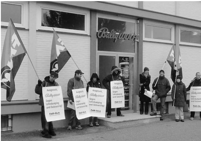
Soliaktion Anfangs 2012 gegen den Spielautomatenhersteller Bally Wulff.

Was uns von anderen Gewerkschaften unterscheidet, hat die FAU Berlin in der letzten Ausgabe (siehe di schwarzi chatz #32) schon super beschrieben. Bei uns entscheiden gemeinsam alle Mitglieder, die sich beteiligen. Und jeder ist auch gefragt, das aktiv zu tun, anstatt auf bequeme Dienstleistungen zu hoffen. Anarchistisch geprägt sind natürlich unsere Grundlagen und unser Blick auf jedes Weltgeschehen. Aber die Arbeitswelt ist und bleibt unser Fokus.