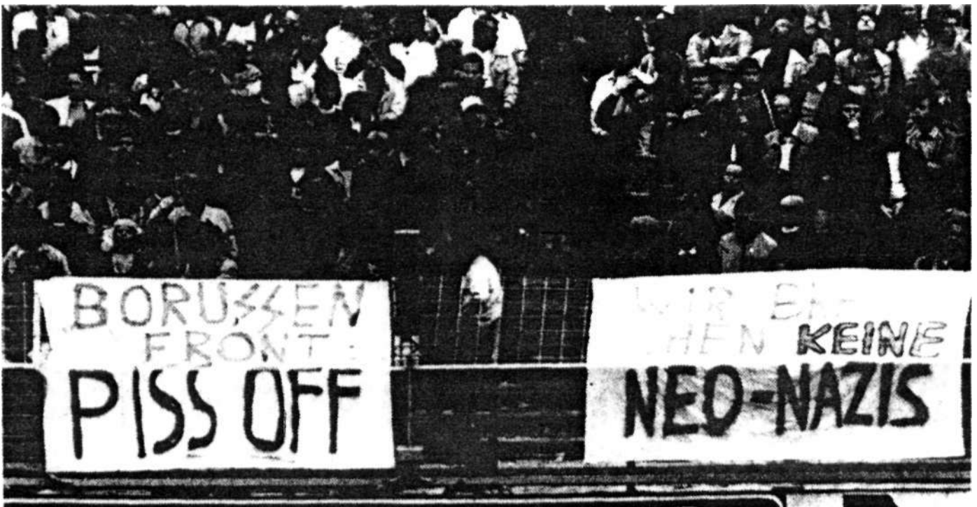
In Leverkusen protestierten Fußball-Fans gegen die Dortmunder Broussenfront