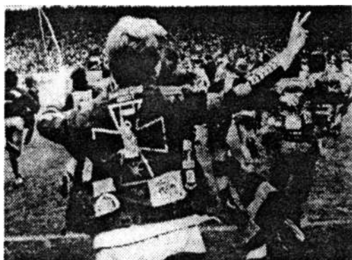
Militaristische Symbole statt Vereinsemlen

Auch Polizei und Justiz tun sich schwer damit, konsequente Maßnahmen gegen die Borussenfront durchzuführen.