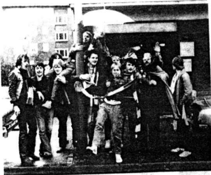
Jugendliche im Dortmunder Norden

Zwei junge Mädchen bekunden uns gegenüber un-verhohlen ihre Sympathie mit der Borussenfront. „Als wir einmal von einer Fete kamen, wurden 'unsere' Jungs von ein paar Türken dumm angequatscht. Da kamen einige Typen von der Borussenfront und haben die fertigmacht. Die haben uns richtig geholfen. Der Großteil von denen ist doch o. k. Nur die 'Brutalen' können wir nicht ab, die immer nur Stunk machen. Unsere Eltern, die haben allerdings Angst vor denen. Wir dürfen deshalb ab 19 Uhr nicht mehr raus. Den Grund wissen sie selbst nicht. Die sagen nur, das und das steht in der Zeitung und das glauben sie dann auch.“