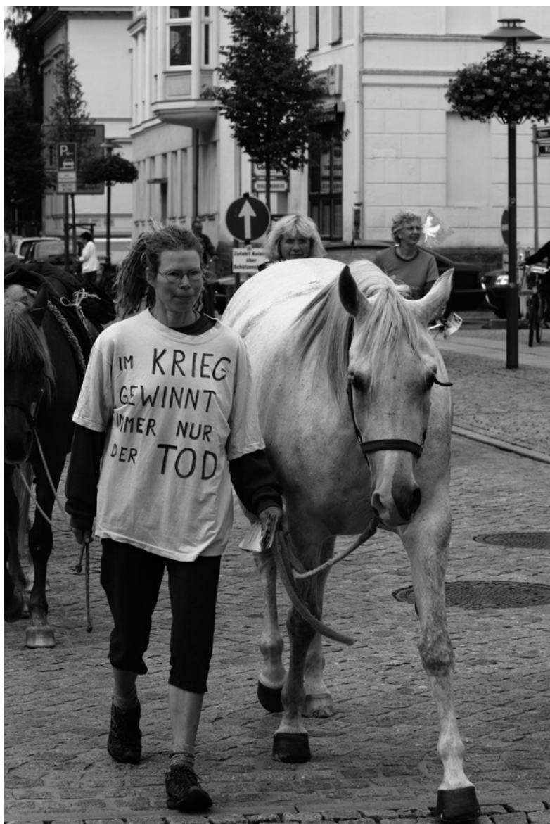
Friedensritt 2009 in der Colbitz-Letzlinger Heide „Im Krieg gewinnt immer nur der Tod“