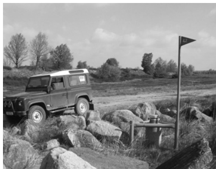
Grundwassermessstelle auf dem GÜZ

Unter der Heide verbirgt sich ein Schatz, ca. 3,3 Milliarden m 3 Wasser von fast idealer Reinheit. Das ist eine Wassermenge, die ungefähr dem 30-fachen Inhalt der Rappbode-Talsperre im Harz entspricht. Dieses Trinkwasser ist regionale Lebensquelle für über 600.000 Menschen.