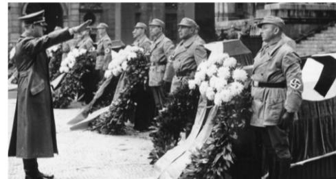
Totengedenken vor der Münchener Feldherrenhalle, 11.11.1939

■ Im August 2007 bedauerte die Wattenscheider NPD, dass sie anlässlich des 20. Todestages des Hitler-Stellvertreters Rudolf Hess keinen Infostand in Wattenscheid aufbauen durfte. Die Partei wollte dort die in Neonazi-Kreisen propagierte These vertreten, dass dieser „Friedensflieger“ ermordet wurde.