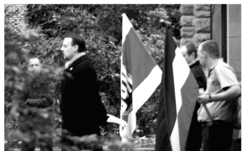
Heldengedenken der NPD Wattenscheid, 13.11.2005