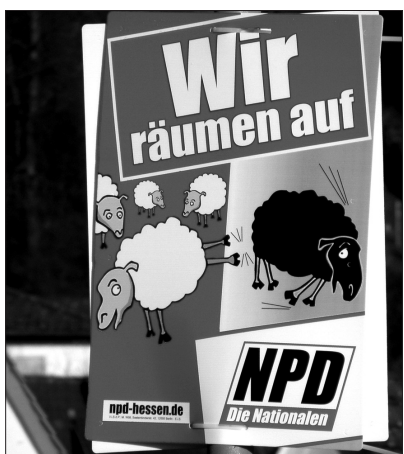
2008er Wahlplakat der NPD

Längst verfolgt die extreme Rechte in Europa die Erfolgsgeschichte der SVP mit Bewunderung und versucht, deren Polit-Rezepte zu kopieren. Gross waren die Begeisterungstürme aus den Parteizentralen des französischen Front National (FN), der Nationaldemokratischen Partei Deutschlands (NPD) und der Freiheitlichen Partei Österreichs (FPÖ) auch nach dem 28. November. Die FN-Chefin Marine Le Pen sah in der Annahme der Ausschaffungsinitiative