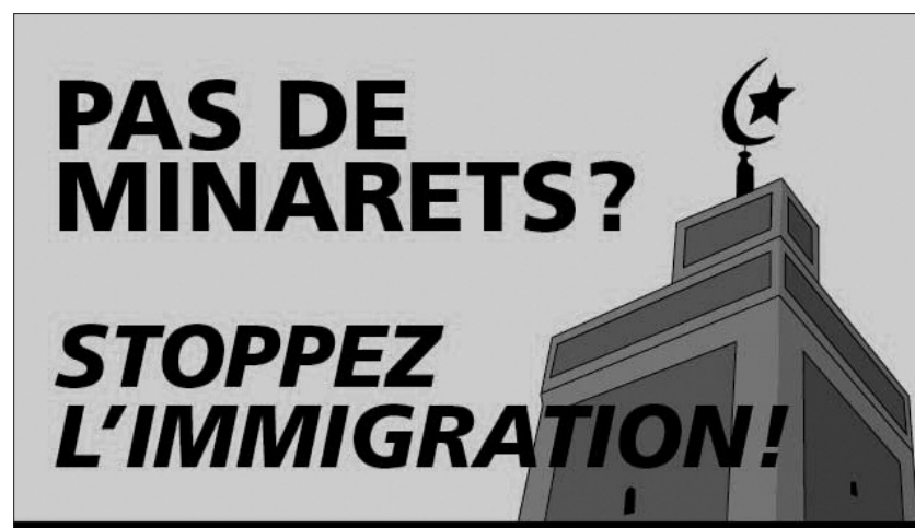
Aufkleber der Jeunesse Identitaire Genève

Problematischer Gast: Ende Juni hielt sich der britische Bischof und Holocaust-Leugner Richard Williamson im Unterwallis auf. Er nahm im Weiler Ecône an Priesterweihen der erzkonservativen Pius-Bruderschaft teil. Gegenüber einem schwedischen Fernsehsender hatte Williamson 2008 den Massenmord an den Jüdinnen und Juden während der NS-Diktatur stark relativiert: «Ich glaube, es gab keine Gaskammern.» Das deutsche Amtsgericht Regensburg hatte ihn deswegen zu einer Busse von 10'000 Euro verurteilt.