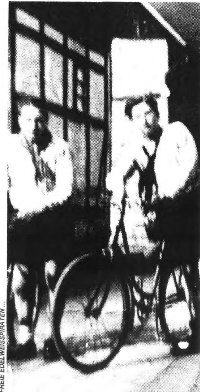
FREE EDELWEISSPIRATEN ...

Die Angriffslust unserer Kontrahenten ließ fühlbar nach. Unsere eigene war schon längst im Eimer. Wir umkreisten uns gegenseitig, täuschten und schlugen auch manchmal zu. Aber nicht mehr so hart. Wir hatten keine Lust mehr und konnten trotzdem nicht aufhören. Trotz der Kälte waren wir